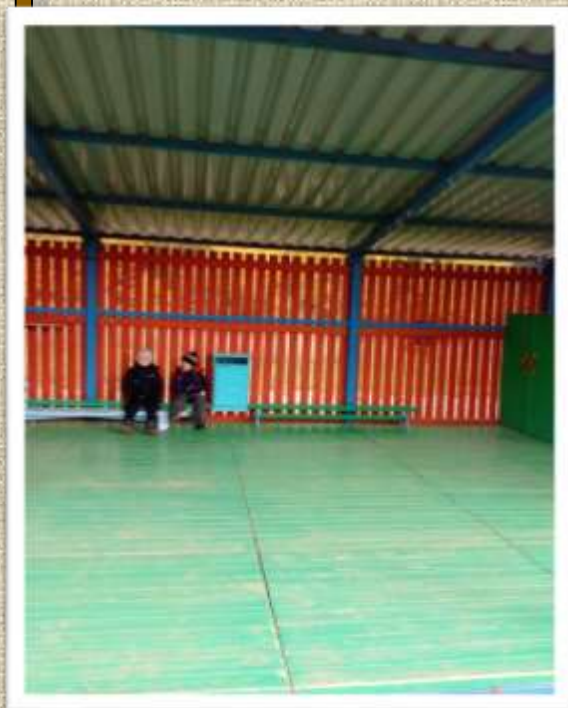
Так выглядела веранда до

В конце сентября мы с ребятами ходили на экскурсию в лес. Рассматривали деревья, любовались красотой осенней природы, собирали опавшие листочки. А когда пришли на свой участок Саша Б. заметил, что на веранде все как-то уныло. И вот, у ребят родилась идея - украсить веранду осенними листочками, которые они собирали в лесу на экскурсии.