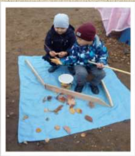
«Ловись рыбка и мала, и велика!»