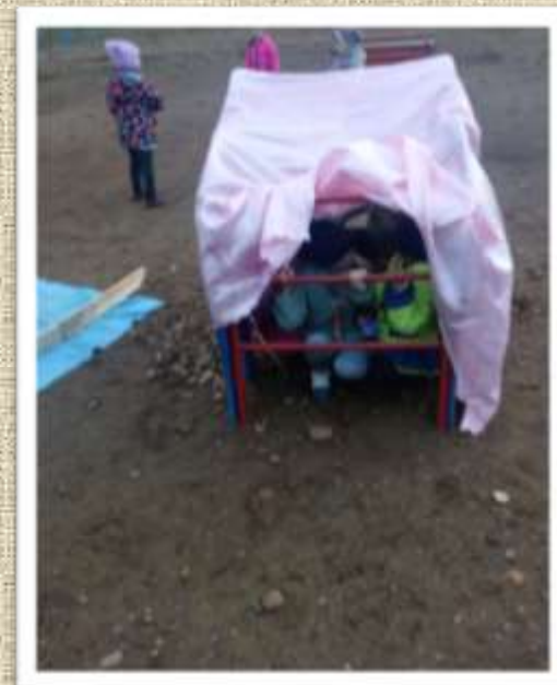
Наш спортивный слоник и кусок ткани послужили в качестве палатки