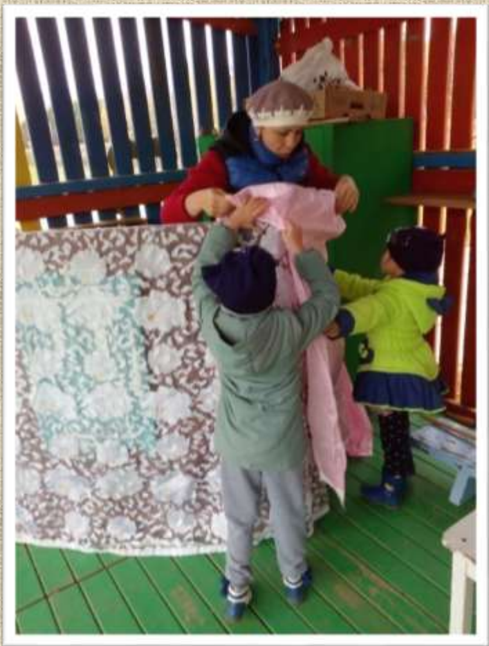
Подготовка сцены идет полным ходом.

Сегодня в музыкальном зале дети поздравляли сотрудников детского сада с днем воспитателя. И у детей возникла идея продолжить концерт на прогулке.