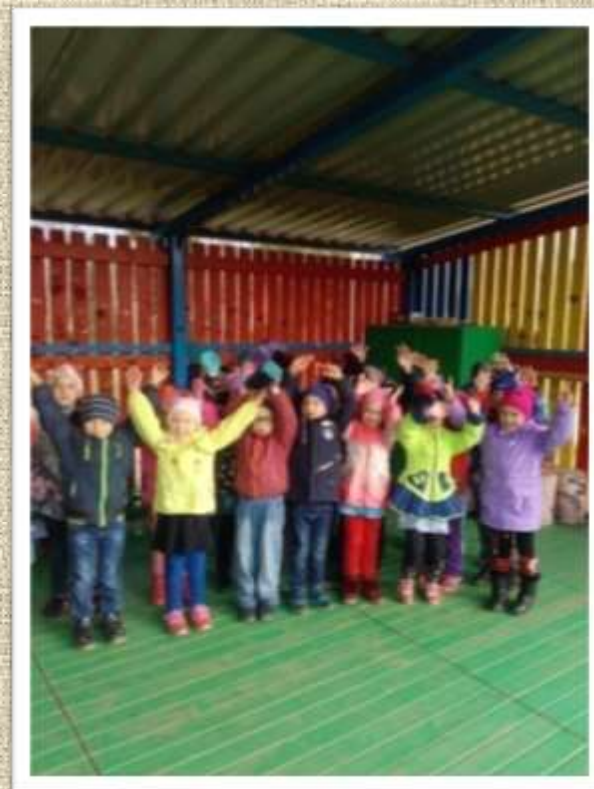
Ура! Веранда украшена