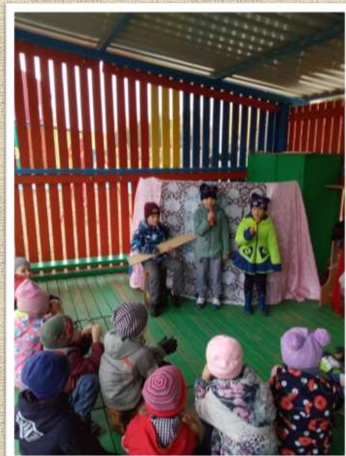
Зритель с нетерпением ждет своих артистов