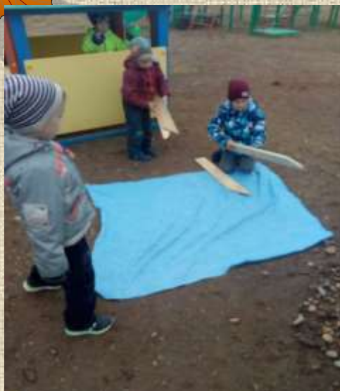
Из куска ткани синего цвета получилось озеро