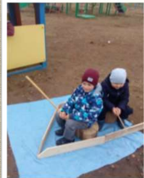
Из дощечек мальчики сконструировали лодку